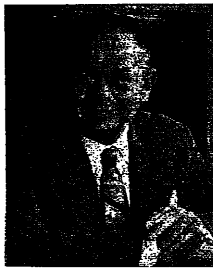
ابن رشد : تلخيص منطق

من هنا، نجم ابن رشد، قد سطر وسط انبعاث السياسة في مراكش، وهو المولود في قرطبة عام 1116 وكان ينتمي الى اسرة عريقة بعيدة الشهرة في علوم الفقه والعلوم الدينية على المنهج المالكي، وعلم الكلام على المدرسة الاشعرية (رغم التاويل واخذ الظاهر على ظاهره - القرن 10م) قديم وحرفه ايضا، الشريعة اصل اول واخر (...). الدكتور جهامي في مجلده الاول يفرغ فصلا مؤلفات ابن رشد ومقالاته (ص 23 - 24 - 25) ويقسمها الى اصنام، منها في المنطق، ومنها في الطبيعيات، ومنها في الفلسفة والفقه والكلام (تفسير ما بعد الطبيعة، تهافت التهافت - الكشف عن مناهج الابن) واخرها في الطب. في الفصل الثاني (27) يحلل المؤلف ابن رشد في تلخيص المنطق ارسطو، ويحلل فرائد منهجية ابن رشد في شرح ارسطو اليونان والعرب حول هذه المسائل، والى كثره للمشاكل الكلامية التي قامت بين الفرق الاسلامية من جهة، والفلاسفة العرب من جهة ثانية واختلافهم الحاد حول هذه المواضيع.